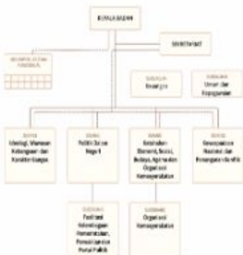
Gambar 1. Organisasi Badan Kesatuan Bangsa dan Politik Kabupaten Serito Selatan